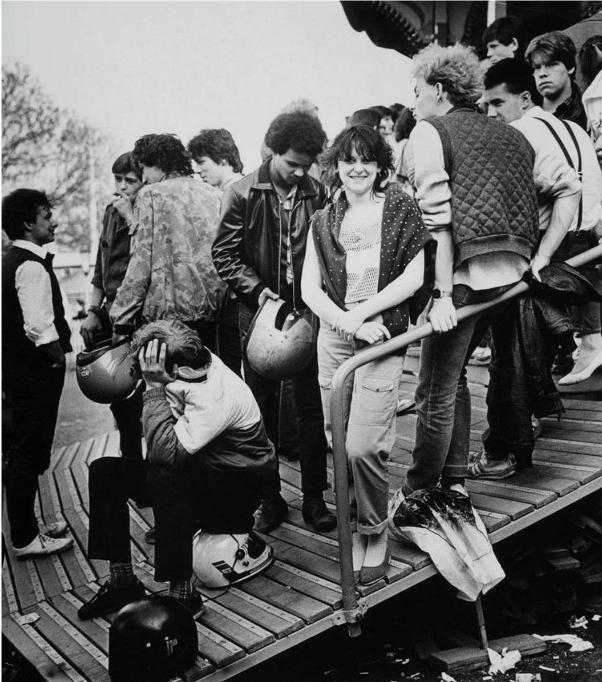
Jóvenes en una Feria en Leipzig, cerca de 1982