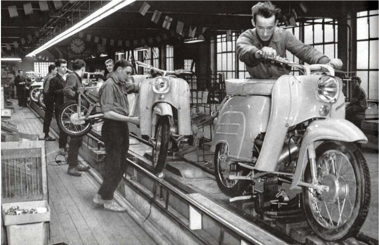
Línea de producción de la motocicleta Schwalbe, en Turingia, Alemania Oriental

Otros estudios han dado cuenta de este fenómeno: apenas el 10% de quienes son jueces en Alemania en la actualidad provienen del Este, y algo similar sucede en la administración pública. En el gabinete actual, salvo la canciller Angela Merkel —quien no nació pero sí se crió y vivió toda su juventud en el Este—, hay un solo ministro, de los 13, que viene del Este. En el ámbito científico sucede lo mismo, así como también en el plano económico: de las 500 empresas de más valor de la actualidad no hay ninguna radicada en el Este. El último dato es llamativo sobre todo en un país que es la primera potencia europea y que, en principio, posee los recursos para promover cierta igualdad entre sus regiones.