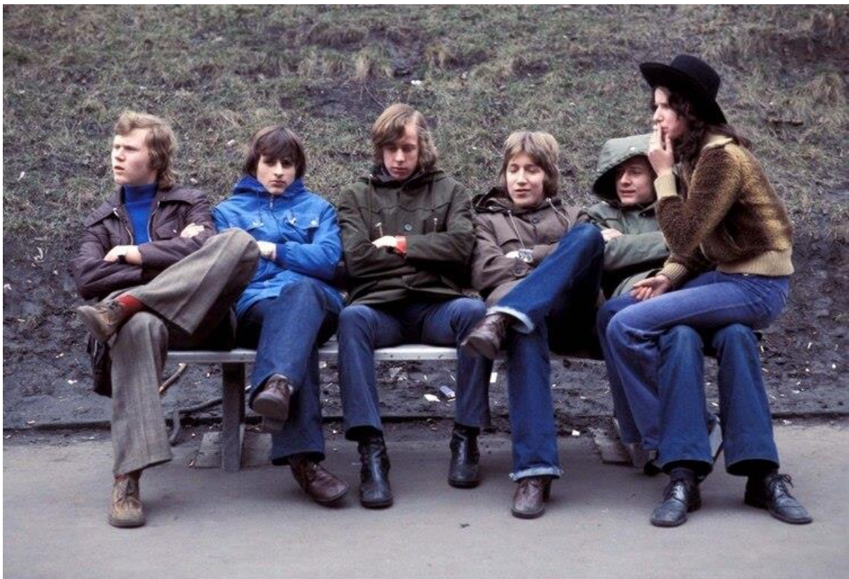
Adolescentes en Alemania Oriental, el 1 de Mayo de 1977

En términos de la composición sociológica de las regiones, también hay diferencias. La falta de oportunidades en el Este ha empujado a muchos ciudadanos a dejar sus ciudades natales con destino a ciudades como Frankfurt, Hamburgo, Munich o Stuttgart , lo que ha provocado un aumento del crecimiento vegetativo mucho más significativo en el Este que en el Oeste. Pero incluso emigrando, según establecen varios estudios sobre el tema, cargan con el peso de sus orígenes orientales debido a su acento.