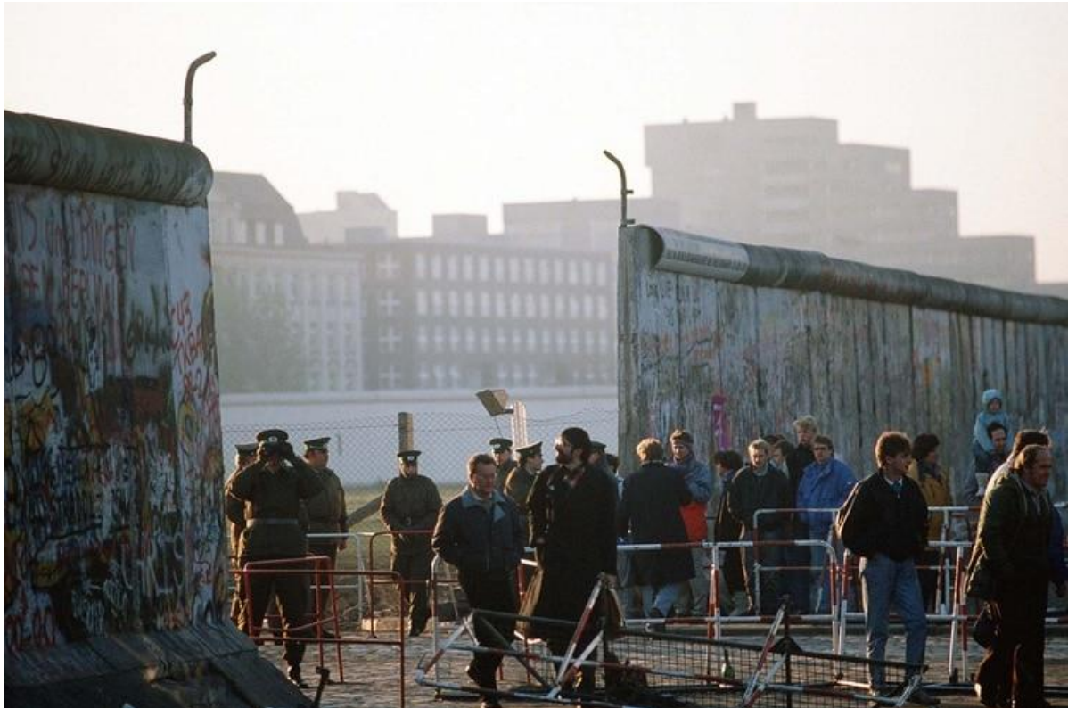
Policía del Este vigilando a la gente mientras cruza el muro el 14 de noviembre de 1989

El término, que juega con las palabras ‘Osten’ -Este- y ‘Nostalgie’ -nostalgia- refiere a un particular fenómeno que surgió tras las manifestaciones, los festejos, y los fuegos artificiales lanzados con la caída del Muro. Cómo el discurso de Alternative für Deutschland empalmó con las frustraciones de los ciudadanos de la extinta RDA