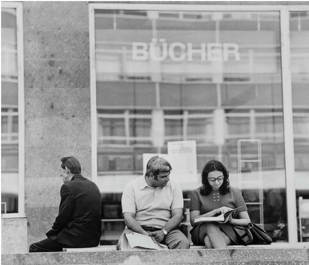
Dos estudiantes leen frente a una librería en los alrededores de la Universidad de Leipzig

El fenómeno, sin embargo, está vinculado con algo que no es exclusivo de la realidad alemana. Matteo Salvini, los españoles de Vox, Marine Le Pen, pero también Donald Trump y Jair Bolsonaro han conquistado a importantes franjas de votantes basándose en un discurso que apela, por un lado, a las frustraciones y, por el otro, a la identidad, con el objetivo de vehicular el descontento social.