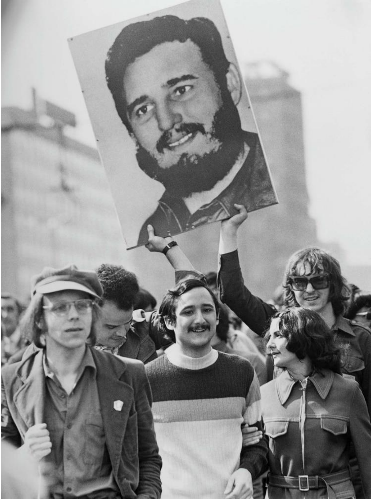
Primero de mayo de 1975, alemanes del Este sostienen una pancarta con la cara de Fidel Castro

“Lo cierto —continúa el experto basado en Berlín— es que en el Este de Alemania tienen problemas que en el Oeste no tienen, y los partidos políticos del Oeste no logran verlo ni vehicular una alternativa para representar a esos ciudadanos. Alternative für Deutschland sí entendió que si ellos dan el debate de la “identidad” pueden ganar apoyos. Die Linke (La