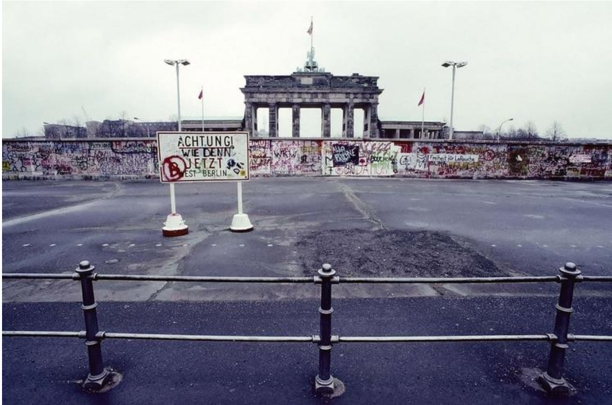
El Muro frente a la Puerta de Brandenburgo, en Berlín, en el año 1989

“Uno podría pensar que no todos se sentían así; por ejemplo quienes debían informar para la Stasi (policía secreta) sobre sus colegas y compañeros. Era horrible sí, pero con todo, seguía siendo gente que tenía un propósito, seguía siendo una sociedad con un sistema. Fallido, disfuncional, pero un sistema con reglas y ciertos procedimientos. La reunificación reemplazó un sistema por otro, pero por aplastamiento. Como cuando en España ocurrió la reconquista y construyeron las iglesias donde antes estaban las mezquitas. Se intentó reemplazar la cultura y la política de un país de raíz. Hay que imaginarse vivir en un país en el que de pronto cambian absolutamente todas las leyes ”, explicó Delle Donne.