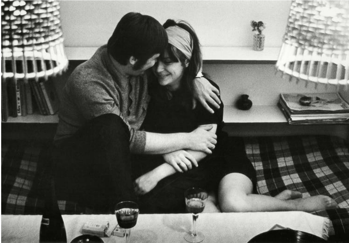
Una pareja en Leipzig, República Democrática Alemana, en 1975