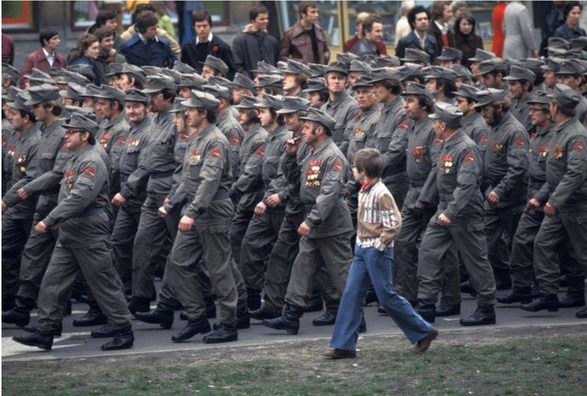
Manifestación por el Primero de Mayo en Berlín Oriental, en 1977

al desempleo. Muchas mujeres, mientras tanto, han tenido que abandonar sus carreras por completo. En suma, en el país que es actualmente el motor europeo, un cuarto de la población vive actualmente en circunstancias económicas poco favorables.