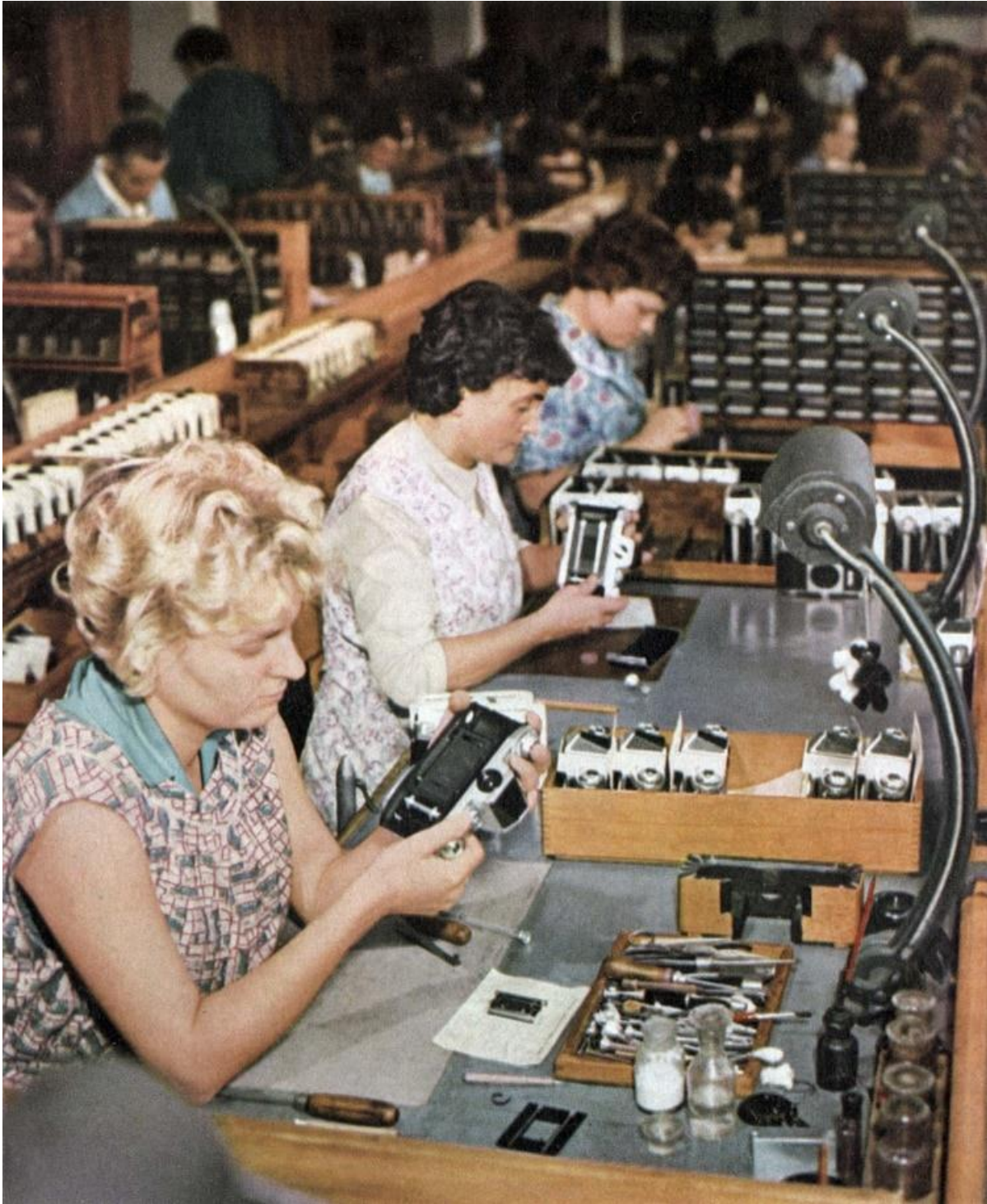
Fábrica de Pentax en Dresden, Alemania Oriental